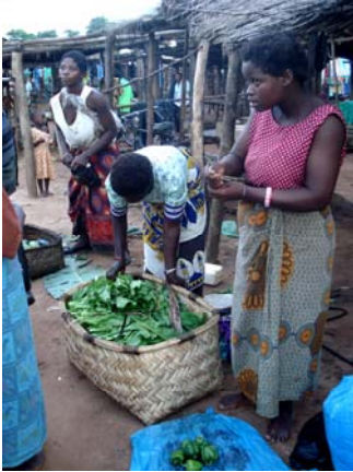
(4372) A En frivillig handler grønnsaker

De fleste innkjøpene av mat foretar vi på lokale markeder som for eksempel i Jali Trading Centre. Lokale hjelpere og handverkere brukes nesten alltid, og det betyr at vi har forholdsvis lave kostnader. Bruk av lokal arbeidskraft gir optimisme, forbedrer tilværelsen i landsbygdene og resulterer i et positivt syn på BLOOM.