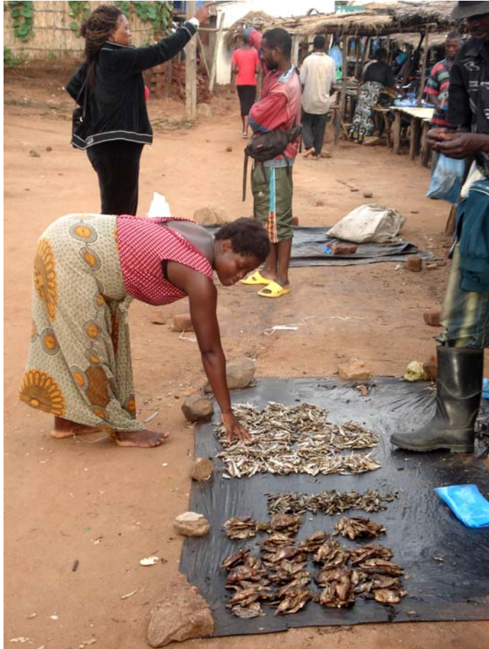
(4354) Innkjøp av tilapia (småfisk)