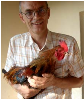
(4536_A) Gave mottatts ---