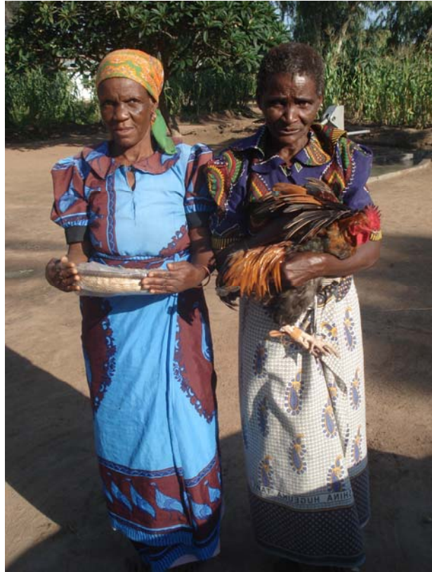
(4523) Gaver overrekkes